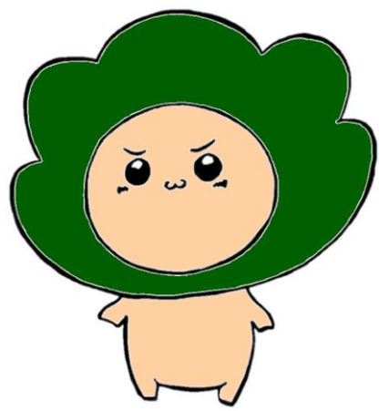
本校キャラクター「はくようくん」