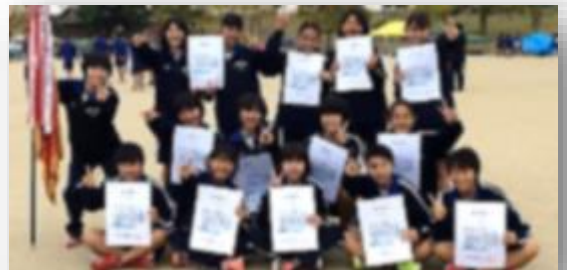
八女地区駅伝 女子チーム