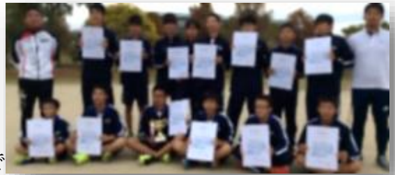
八女地区駅伝 男子チーム

男子は全27チーム中、Aチーム準優勝、Bチーム16位、女子は全22チーム中、Aチーム優勝、Bチーム7位の好成績を残しました。また、個人でも下記の通り、各区間で表彰を受けています。