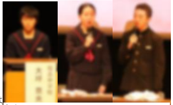
広島 平和学習事業

11月4日(日)、おりなす八女にて「八女市教育の日」事業が開催されました。広島市平和学習事業の発表では2年 さんと、巨済市文化交流事業の発表では2年 さんと3年 さんがステージに上がり報告するなど堂々と役割を果たすことができました。たくさんの保護者の方にご来場いただき、ありがとうございました。暖かい拍手は子どもたちにとって、心強かったと思います。