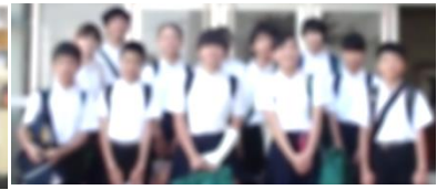
[長峰小への読み語り]