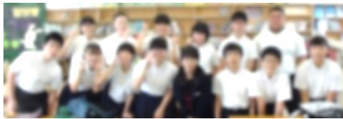
[福島小への読み語り]

実は、「相手意識」について、こんなことがありました。先日、小学校へ読み語りに行った人たちが、「相手が小学生であることを考え、ちゃんと相手意識を持って読み語りができていた」と小学校の教頭先生から褒められたのです。小学生に伝わるように、読む速さや声の大きさ、表情など、相手のことを考えて取り組む姿があったのだと思います。