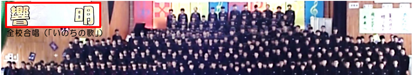
1の3スローガン「一唱響団」