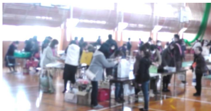
バザー会場の体育館（混み合うレジ）

協賛いただいた方々、ご来場いただいた地域の方々、P T A役員及びO Bの方々、各委員の方々、心から感謝申し上げます。