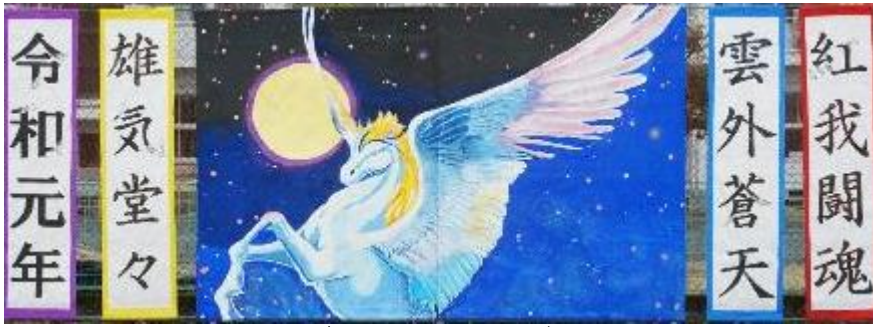
ブロックスローガン