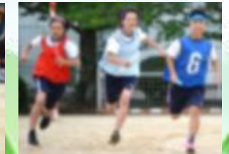
ブロック対抗リレー