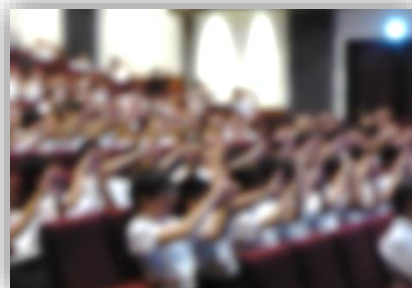
<自分の「利き目」を確認している様子>