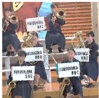
迫力あるブラスバンド部の演奏です！