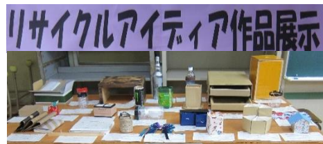
リサイクルアイディア作品展示