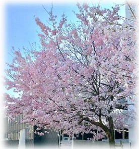
＜福島中体育館西側の桜＞

さて、このたびの人事異動により、8名の転出・退職と、7名の転入がありました。 転出・退職の先生方は、在籍の長短はありますが、福島中学校の生徒たちのために、しっかりと力を尽くしてくれました。心からの感謝とともに、今後ますますの活躍を祈念します。 また、新しく福島中学校の職員として転入された7名は、はじめこそ緊張の面持ちでしたが、今では優しくも力強く、生徒たちと一緒に頑張って奮闘してくれています。昨年度に引き続き職員も含め、福島中の教職員が丸となって活力ある学校づくりに取り組みんで参りたいと思います。どうぞ、ご理解とご協力を願ひします。