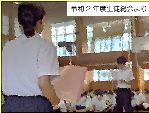
令和2年度生徒総会より